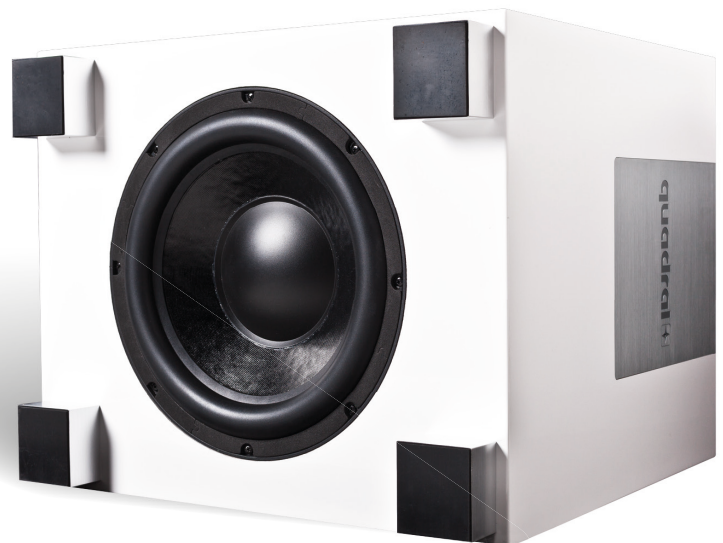
Tieftöner QUBE 12